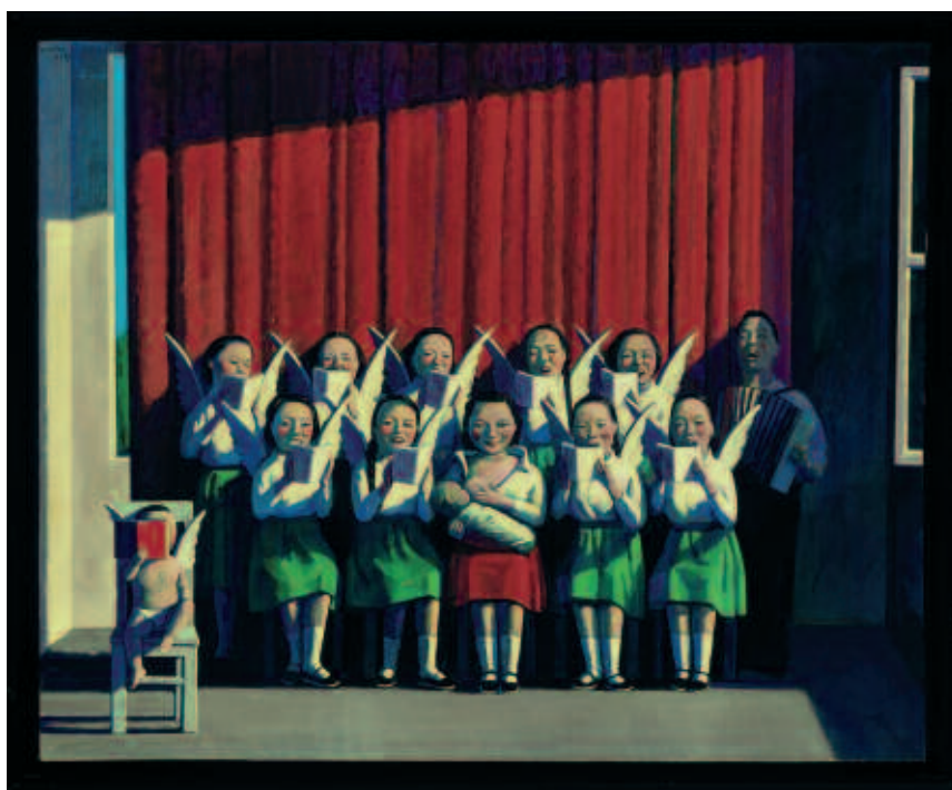
"Beijing Madonna", Liu Ye. Christies

Frente a quienes temen que este fulgurante aumento de las cotizaciones responda sólo a un espejismo especulativo, algunos especialistas argumentan que en China existen numerosos talentos por descubrir, y que era sólo cuestión de tiempo su reconocimiento crematístico, puesto que sus obras cotizaban a valores muy bajos hasta el año 2003. Pero ¿por qué el arte chino se ha puesto de moda? tal vez porque ofrece algo completamente diferente que brinda al coleccionista el sentimiento de descubrimiento. Como insisten los expertos, a pesar de