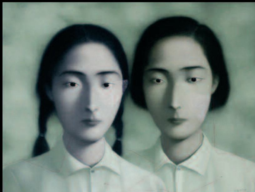
"A Big Family", de Zhang Xiaogang.

La eclosión de la fotografía en el mercado artístico mundial cuenta en China con un grupo de significativos creadores visuales que difunden sus trabajos en las bienales de Pekín, Shangai, Guanzou y el Festival Anual de Fotografía de Pingyao. En la nómina de fotógrafos con mayor repercusión, es obligado citar al consagrado Yang Fudong, cuyas instantáneas se comercializan entre 3.000 y 15.000 euros, y ya ha estado representado en la Documenta de Kassel, la Bial de Shangai y la Bial de Venecia. La terna de fotógrafos emergentes más valorada por los coleccionistas internacionales incluye a Wen Feng , que vende sus trabajos de 2.000 a 5.000 euros, al tiempo que sus vídeos oscilan entre 7.000 y 15.000 euros; Zao Badi , de quien se hallan fotos desde 2.000 hasta 25.000 euros, y Xiang Liqing , cuyas fotos llegan hasta 10.000 euros.