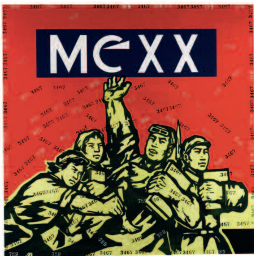
"Great criticism : Mexx", de Wang Guanyi. Sotheby's

E l año 2007 ha sido el mejor para el arte chino, celebrándose las diez subastas más exitosas hasta la fecha