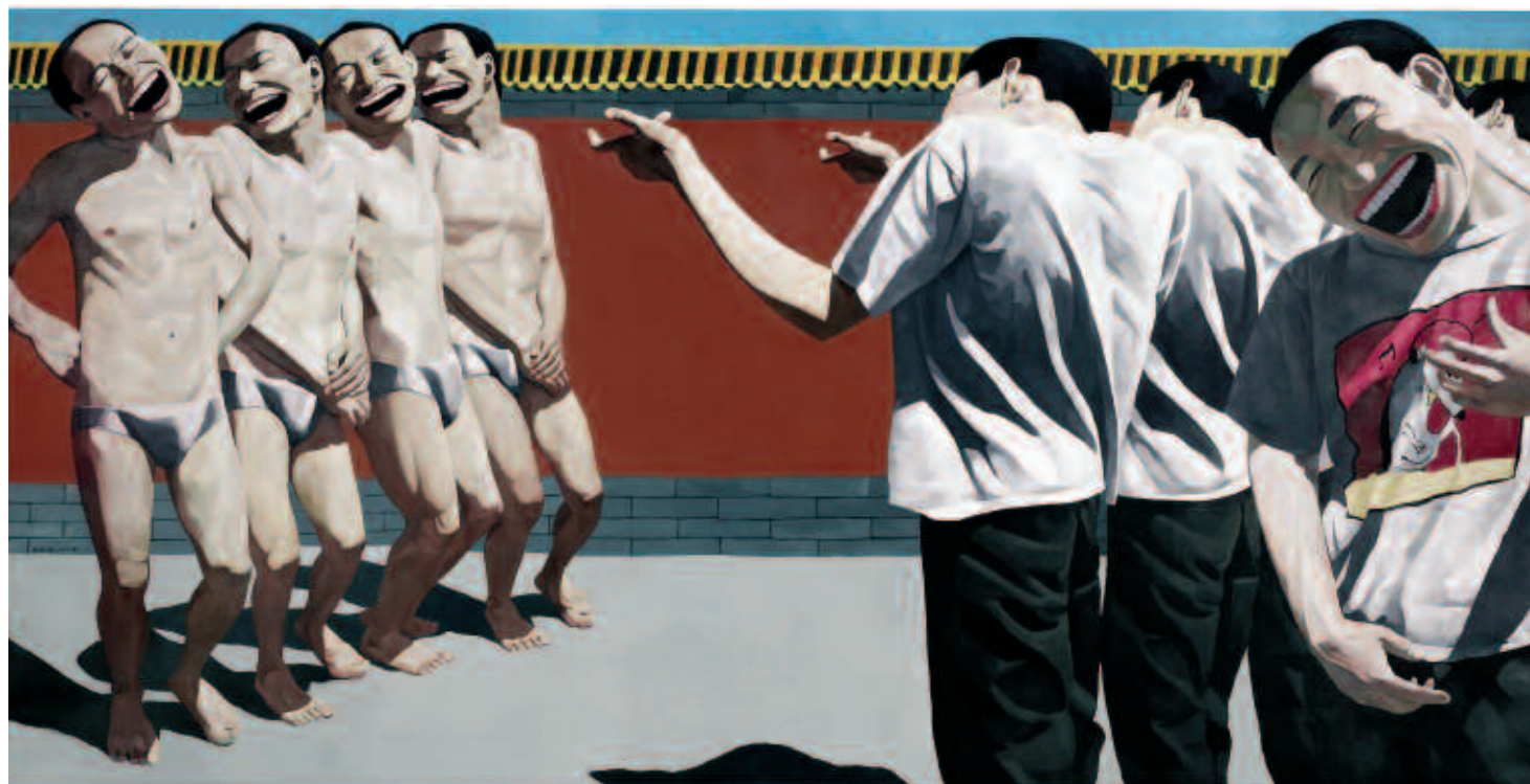
Execution", Yue Minjun. Sotheby's

manera de los retratos de familia de los años 50 y 60. El pasado octubre Sotheby's vendió una de sus emblemáticas Family series , por un millón de euros, mientras que Phillips & de Pury entregaba por esa misma cifra su Bloodline Series .