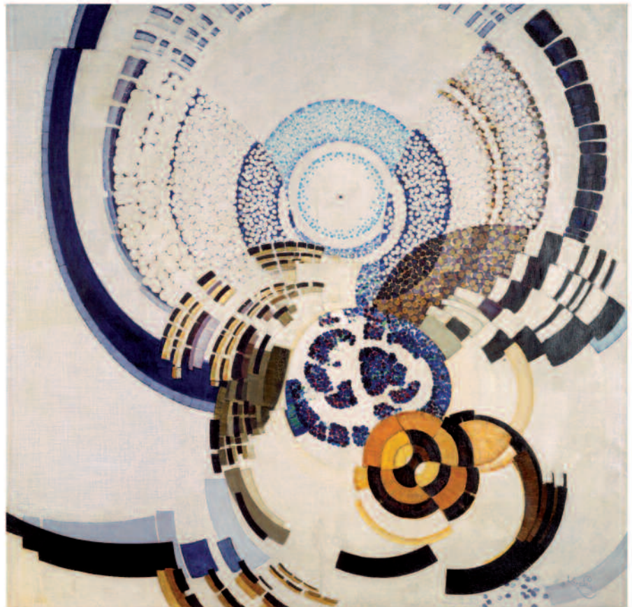
František Kupka: Autour d'un point, c. 1920-1930, MNAM Centre Pompidou, Paris