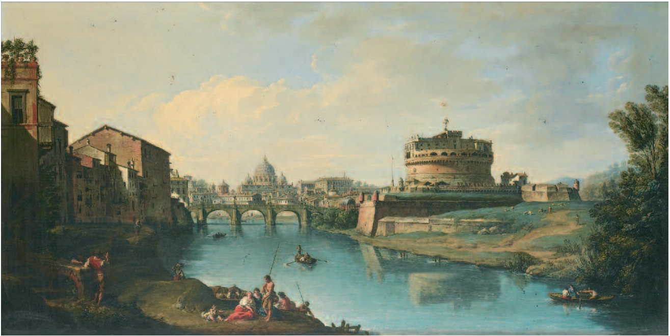
Vista de Roma desde el Tíber, Giuseppe Zocchi . Rematada en 1.3 millones de libras. Julio 2009. Bonhams.