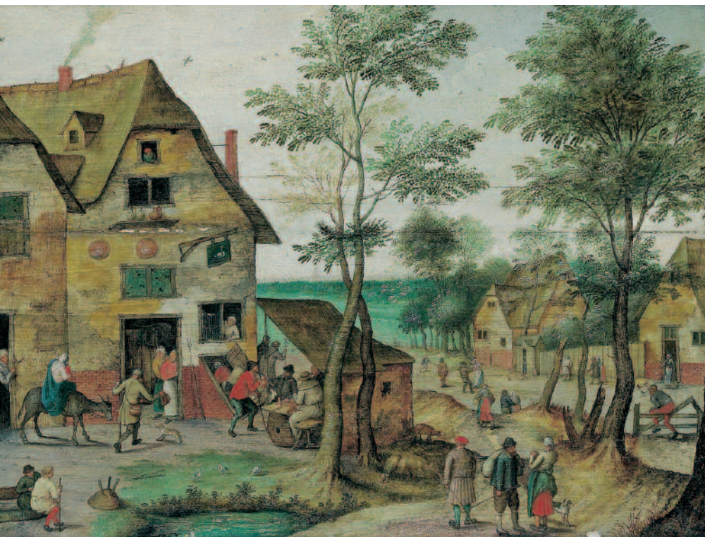
Escena de un pueblo buscando refugio, Pieter Brueghel el Joven. Rematado en 696.000 euros. Abril 2006. Dorotheum, Viena.