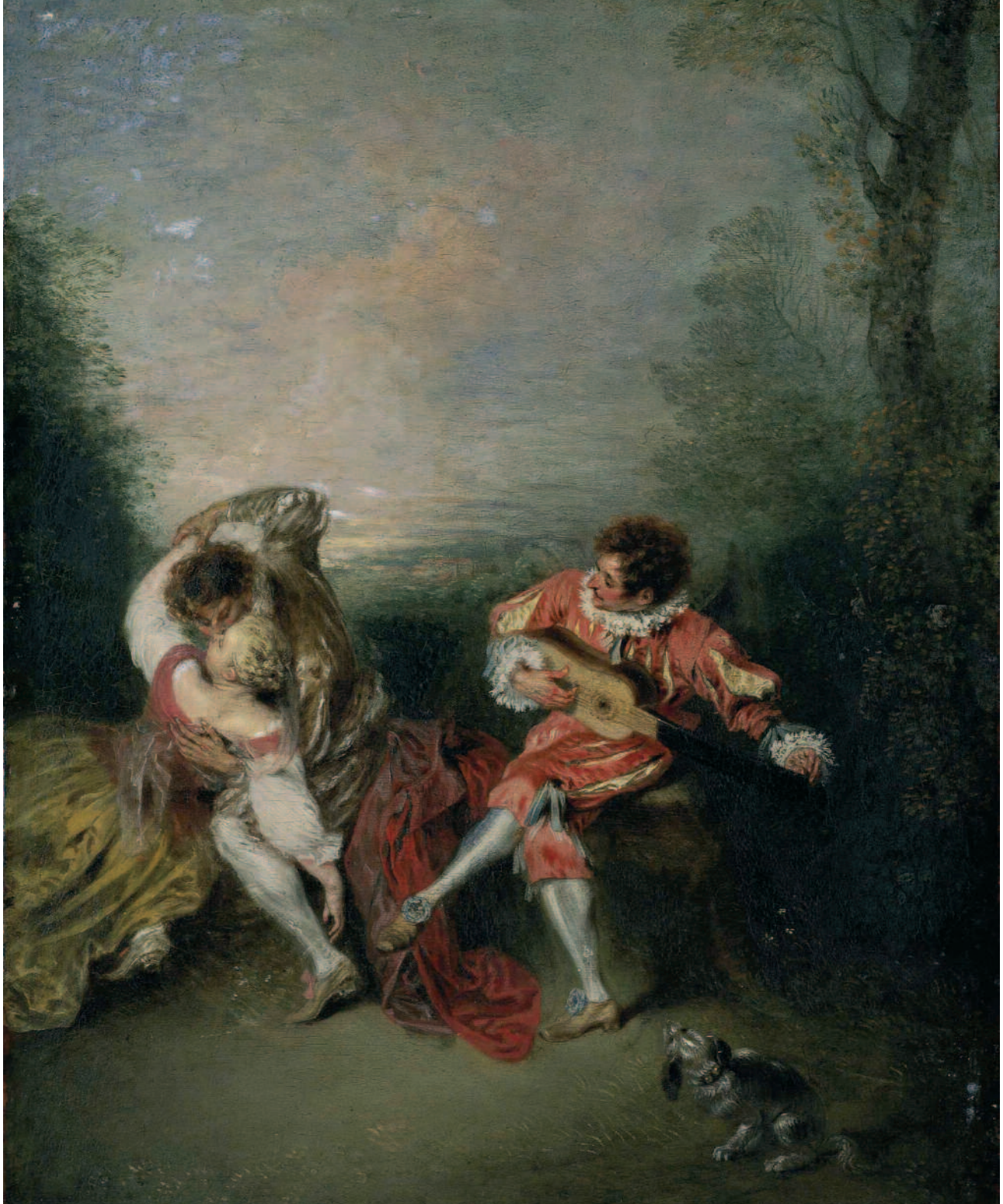
La sorpresa , Jean-Antoine Watteau . Rematado en 15,5 millones de euros. Récord del mundo para un maestro antiguo francés. Julio 2008. Christies, Londres.

la política fiscal de cada Estado. Aquellos países donde existen incentivos fiscales para donaciones de obras de arte a colecciones públicas (Estados Unidos) o como dación por pago de impuestos (Reino Unido) favorecen el movimiento de colecciones privadas a públicas; por el contrario, allí donde no se dan estas condiciones (Italia, Grecia, etc...) este trasvase es menor”