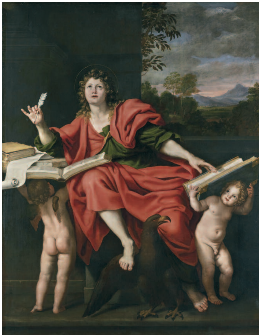
San Juan Evangelista , Il Domenichino . Subasta en Christies Londres 8 de diciembre. Salida 7,7 a 10,5 millones euros