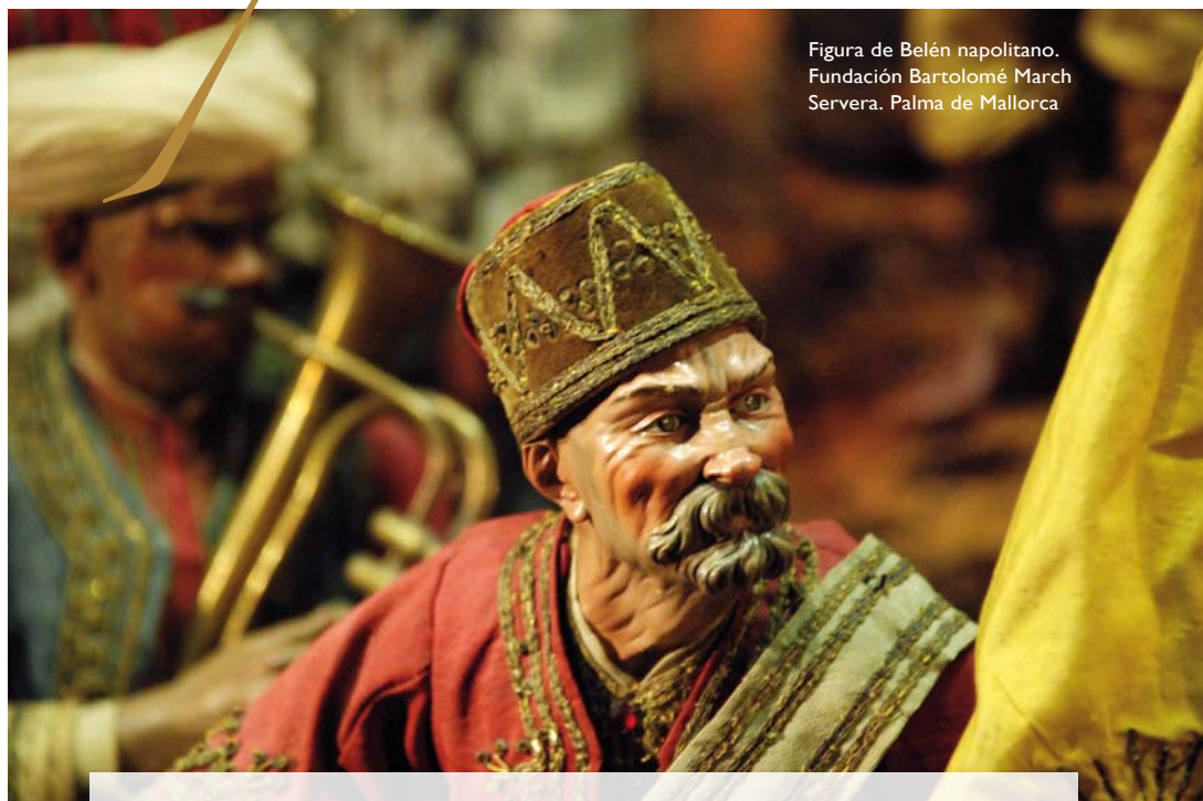
Figura de Belén napolitano. Fundación Bartolomé March Servera. Palma de Mallorca

Las figuras del belén napolitano son especialmente frágiles. El cuerpo está formado por un armazón de alambre forrado con estopa, materiales muy flexibles, que permiten crear figuras en muy diversas posiciones siguiendo la expresividad estilística del dinamismo barroco. Las extremidades son de madera; la cabeza, de terracota policromada con los ojos de pasta vítrea, trabajados con notable minuciosidad para conseguir la máxima expresión del rostro; y los vestidos, de sedas o tejidos de la época, con pasamanería, y