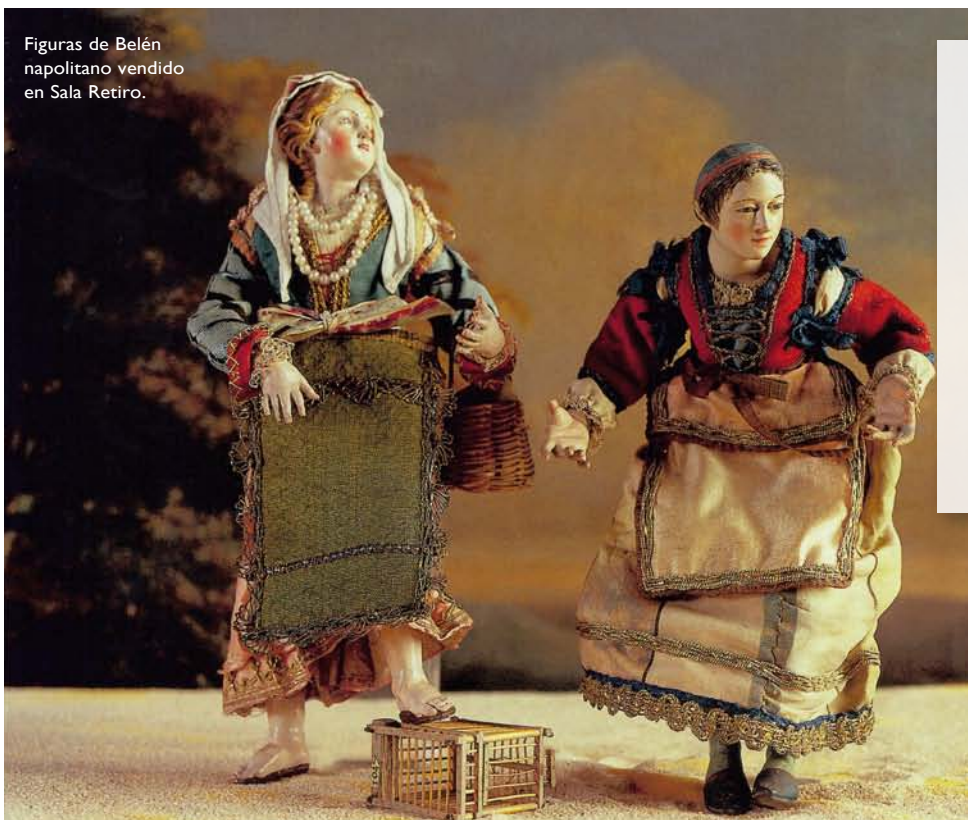
Figuras de Belén napolitano vendido en Sala Retiro.