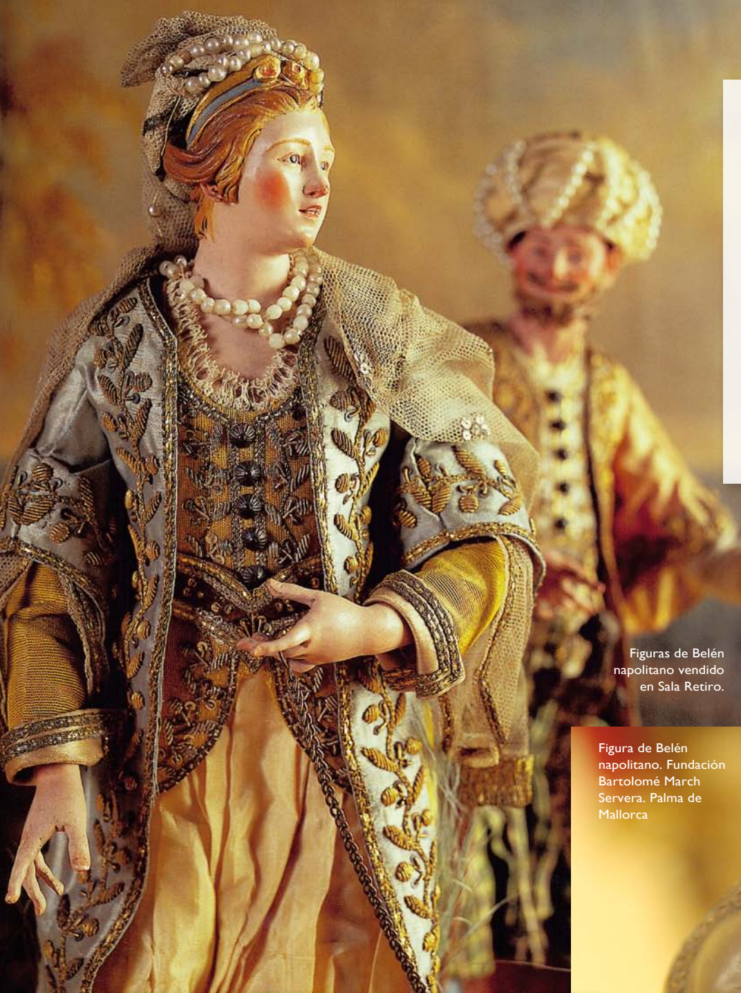
Figuras de Belén napolitano vendido en Sala Retiro.