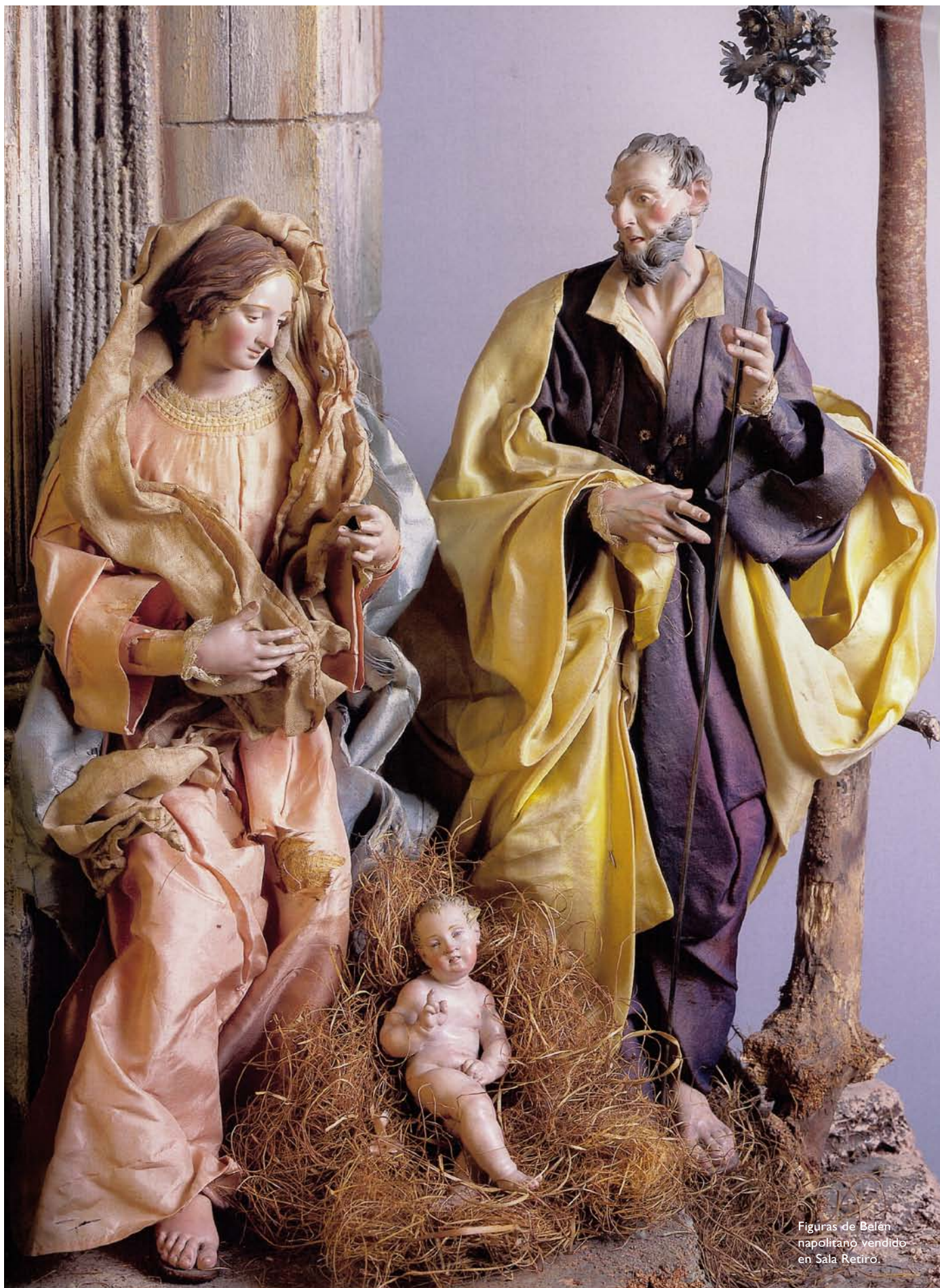
Figuras de Belén napolitano vendido en Sala Retiro.