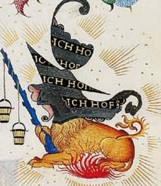
El Libro de las Grandes Horas de Galeazzo Maria Sforza, Duque de Milán, 1471-1476