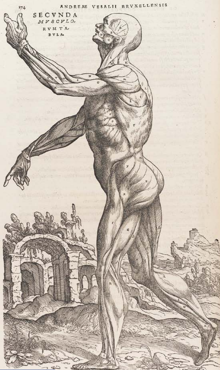
De humani corporis fabrica libri septem, Andreas Vesalius