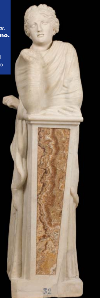
La Musa Polimnia apoyada en un pilar. Anónimo. Madrid, Museo Nacional del Prado

La nueva Biblioteca Alejandrina es un homenaje a la memoria y una apuesta por el futuro