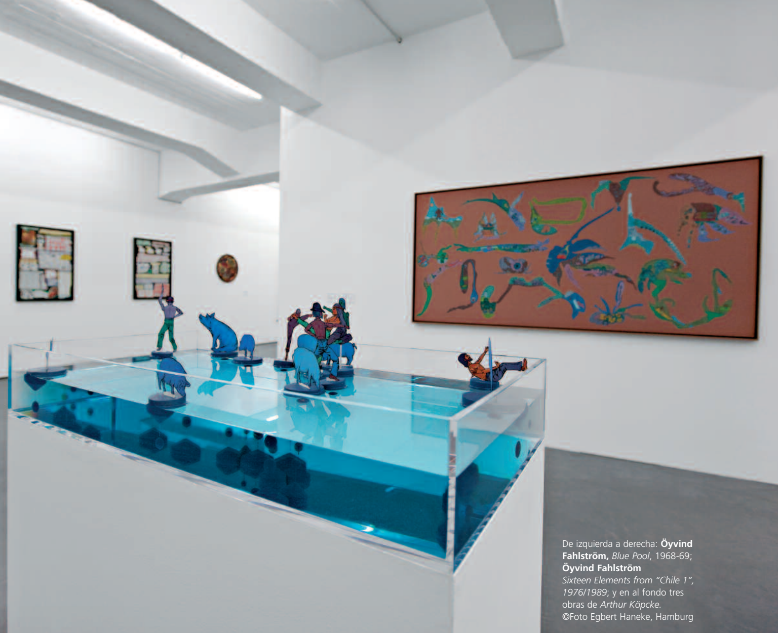
De izquierda a derecha: Öyvind Fahlström , Blue Pool , 1968-69; Öyvind Fahlström Sixteen Elements from "Chile 1" , 1976/1989; y en el fondo tres obras de Arthur Köpcke.

¿Se acuerda de todas las obras que posee?