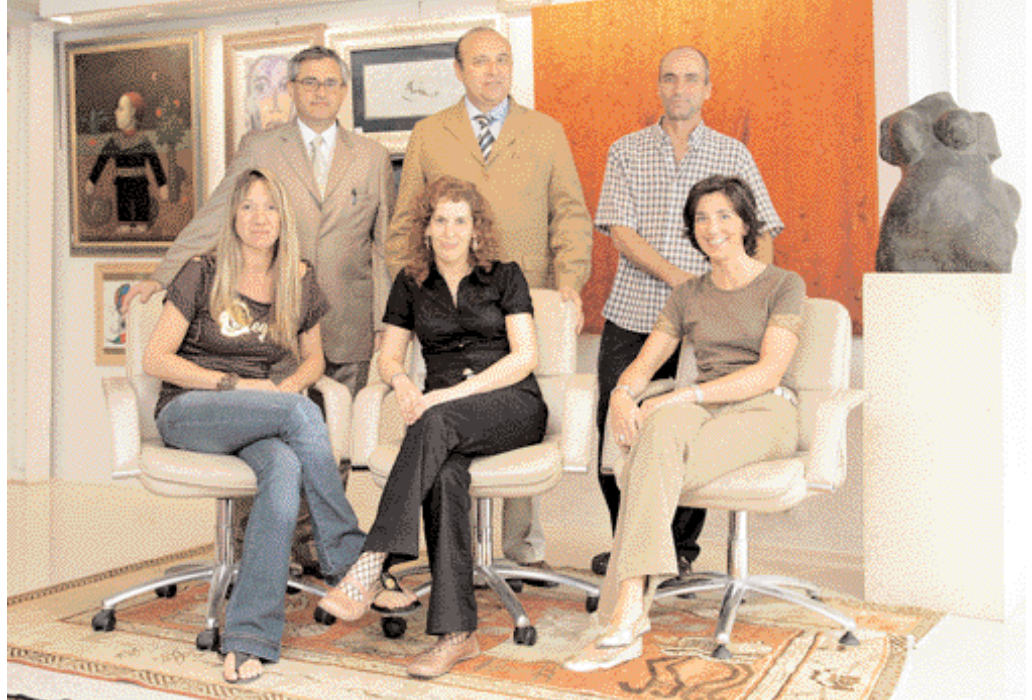
Equipo de la sala Appolo.