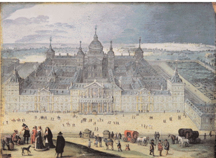
"Vista de El Escorial". Louis de Caullery. 129.000 euros. Alcalá