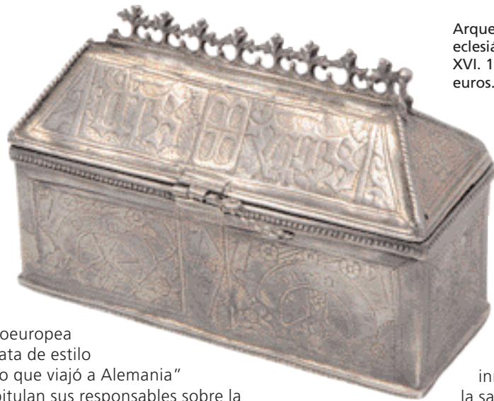
Arqueta eclesiástica siglo XVI. 15.000 euros. Appolo.

centroeuropea en plata de estilo gótico que viajó a Alemania" recapitulan sus responsables sobre la temporada, incidiendo en el hecho de que "gracias nuestra página web - www.subastas-appolo.com - uno de nuestros instrumentos de trabajo básicos, hemos ampliado nuestra base de clientes. En estos momentos estamos trabajando para que sea una página bilingüe que nos permita acceder a todos los rincones del mundo". Entre sus planes más