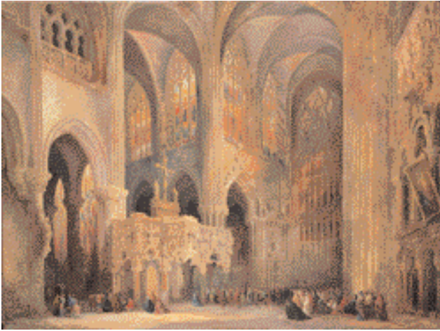
“La Catedral Saint Jacques le Mineur en Lieja”, de Genaro Pérez Villamil. 165.900 euros . Durán