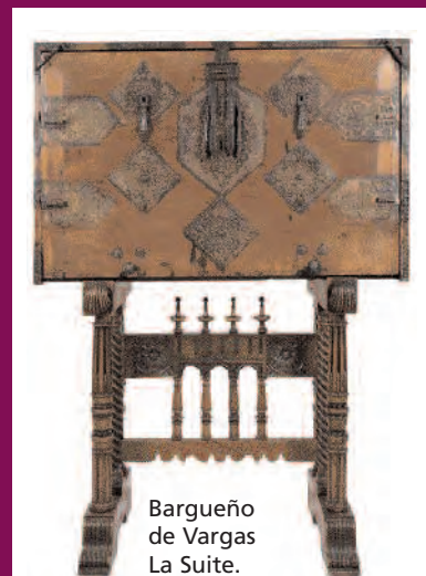
Bargueño de Vargas La Suite.

XVIII rematada en 18.000 euros en la sala Goya, y un bureau Imperio en caoba, fechado en 1815, por el que se pagaron en Ansorena 28.000 euros. El capítulo de los bargueños deparó interesantes cotizaciones: un bargueño Vargas del siglo XVII fue vendido en La Suite por 32.500 euros, mientras que otro bargueño colonial español en nácar, carey y ébano, del siglo XVIII, se dispersó en Segre por 27.000 euros; Gran Vía de Bilbao adjudicó en 14.000 euros un bello ejemplar castellano del siglo XVII.