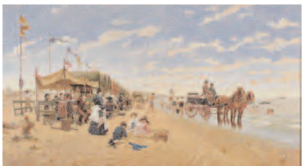
La playa de Sanlúcar de Barrameda, Germán Alvarez Algeciras. 60.000 euros. Goya Subastas