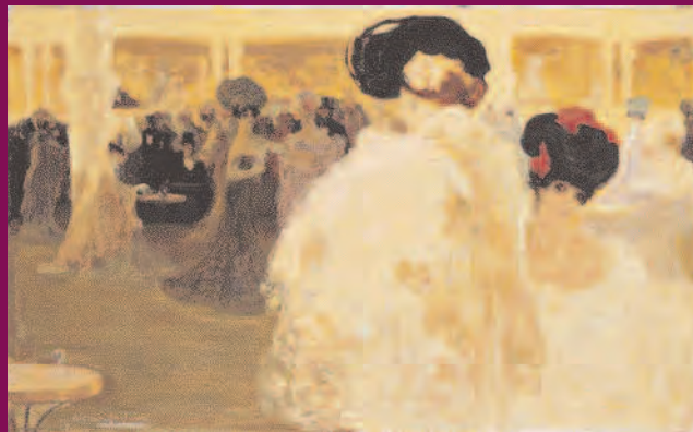
"El Casino de París" de Anglada Camarasa.

El Casino de París, de Hermenegildo Anglada-Camarasa se convirtió el pasado 4 de octubre, en el marco de la subasta anual de pintura española que Christies celebra en Madrid, en el cuadro más caro de la historia de las subastas españolas, al rematarse en 2.924.000 euros. 15 millones de euros fue el monto final de aquella licitación, lo que representó un aumento del 95 % respecto a los 8 millones de euros de la convocatoria precedente.