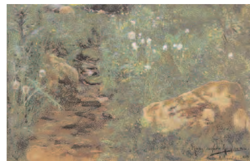
Riachuelo con rocas. Arbuscias De Hermen Anglada Camarasa.