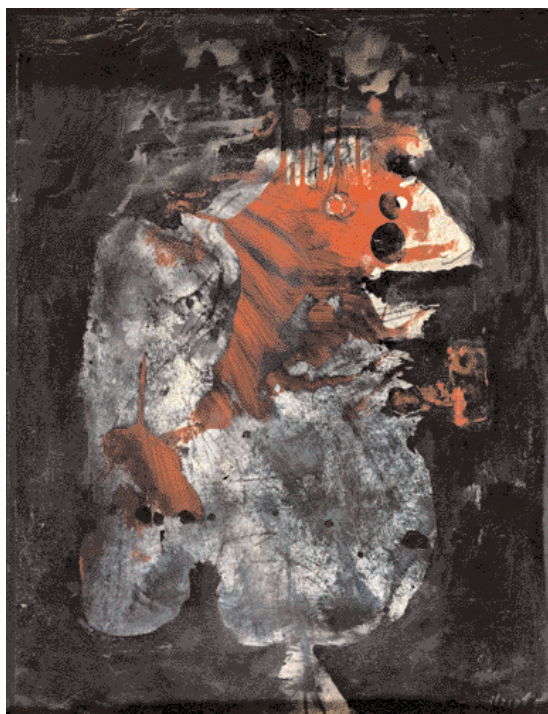
“Roi”, de Antoni Clavé. 48.000 euros. Balclis