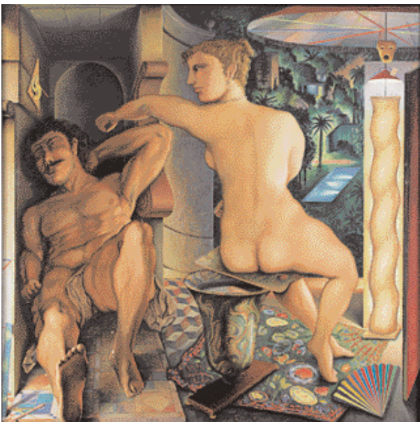
"Sansón y Dalila", de Guillermo Pérez Villalta. 60.000 euros. Alcalá.