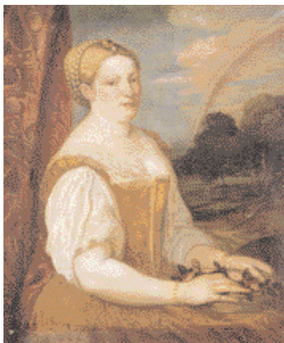
"Retrato de dama", de Tiziano.