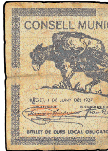
"Águila", Francesc Vidal i Jevellí. 30.000 euros. Bilbao XXI