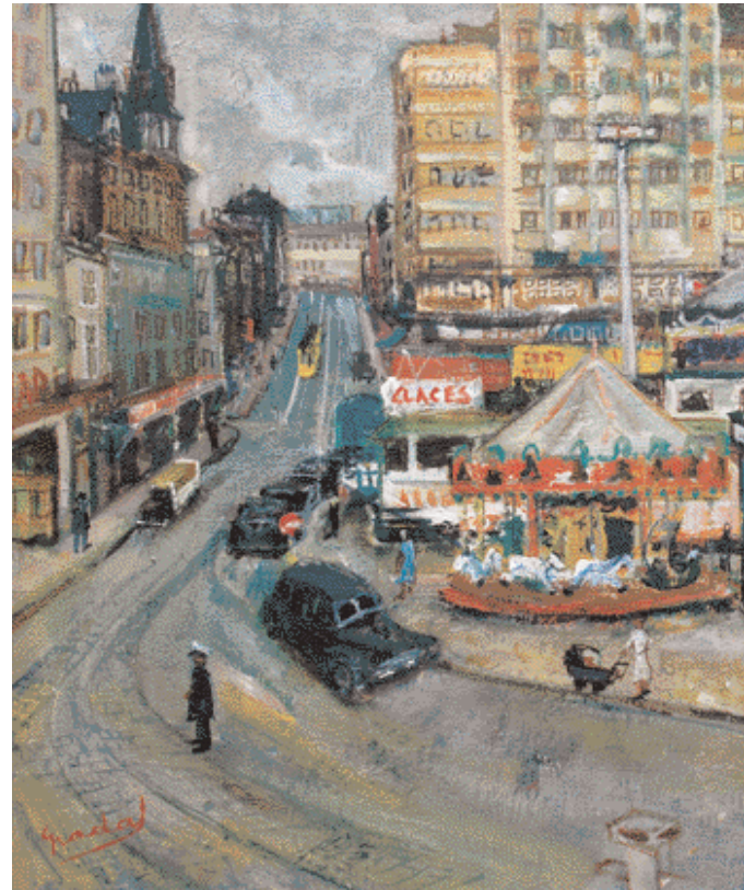
"Q. D'Ivry" de Carles Nadal. 30.826 euros. Lamas Bolaño