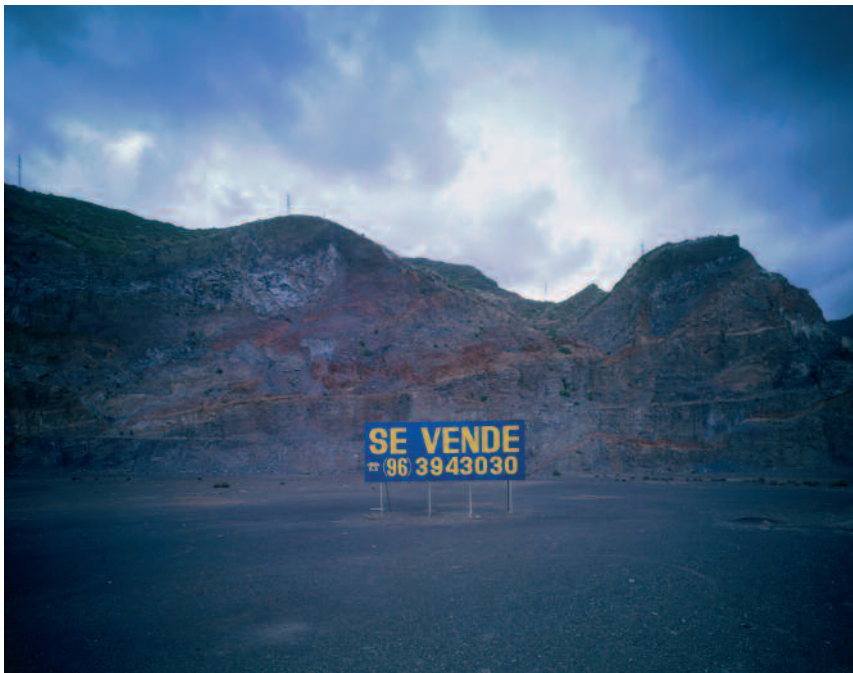
Juan del Junco. Casas Viejas –Embalse de Celemín, 2009. 10ª Bial Martínez Guericabeitia

a engrosar una colección que crecía a pasos agigantados.