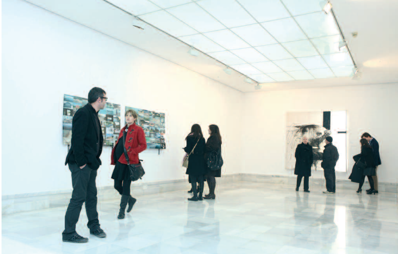
Imagen de la Bienal Martínez Guerricabeitia