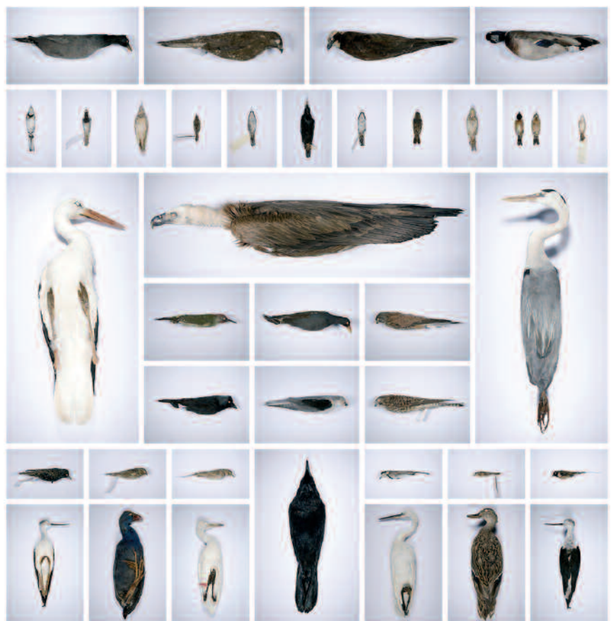
Jordi Bernadó. S/T, 2004. 10ª Bial Martínez Guericabeitia

Museo de la Ciudad · Plaza del Arzobispo, 3. 46003 Valencia