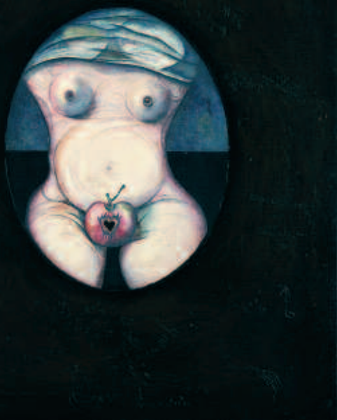
Eva, Modest Cuixart. 1966 (Fundació Vila Casas).

próximos a visiones cosmológicas. Pero a mediados de los 50, Cuixart retomó su expresionismo, anterior a Dau al Set, de experimentaciones plásticas con materiales de desecho de la posguerra, y aquel dramatismo condujo a su etapa informalista, en la que la materia y el objeto tuvieron una gran importancia. En los años 60, sus muñecas destrozadas causaron un gran impacto y revelaban una gran angustia existencial. Más adelante, el informalismo matérico compartió la estética magicista y erótica, que fue acabando con el informalismo matérico para llenar toda su obra la figura humana. En 1970, Cuixart se instaló en Calella de Palafrugell y con su sentimiento frente al paisaje y del contacto con la naturaleza nacieron pinturas de renovado lirismo. En estos momentos se expone en la Fundació Vila Casas, en Can Mario de Palafrugell obras desde Dau al Set a etapas recientes, que permite valorar la impronta que el surrealismo ha ido dejando a lo largo de su obra, buscando siempre el erotismo, la sensualidad, la seducción y el sueño, ya sea en un entorno físico o metafísico. En una subasta nacional, en 2002, No-pipa, una de sus muñecas (83 x 74 x 21,5 cm) se vendió por 16.800 euros. Sus composiciones de finales los años 50 se han vendido por un valor entre los 10.000 euros y los 16.000 euros; la que llegó a cotas más altas fue su Homenaje a Lorca (TM/L. 162 x 130 cm), que se adjudicó por 21.000 euros a finales de 2004.