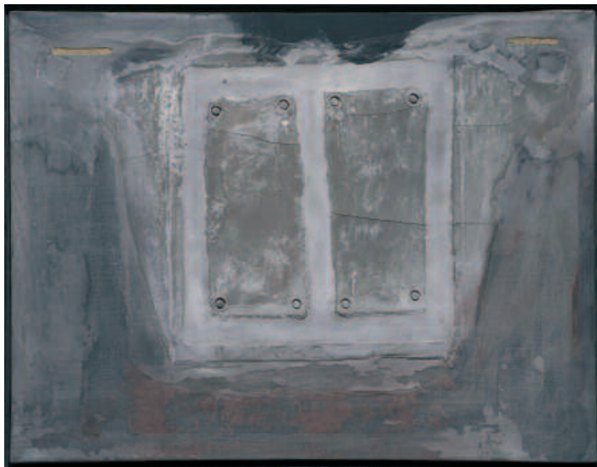
Gris con dos formas, Antoni Tàpies. 1960 (Christie's Madrid)

Los artistas que formaron Dau al Set siguen ganando reconocimiento y prestigio, hecho que va revalorizando sus obras. La cotización de los históricos del grupo es muy diversa; son todavía asequibles y es una buena inversión.