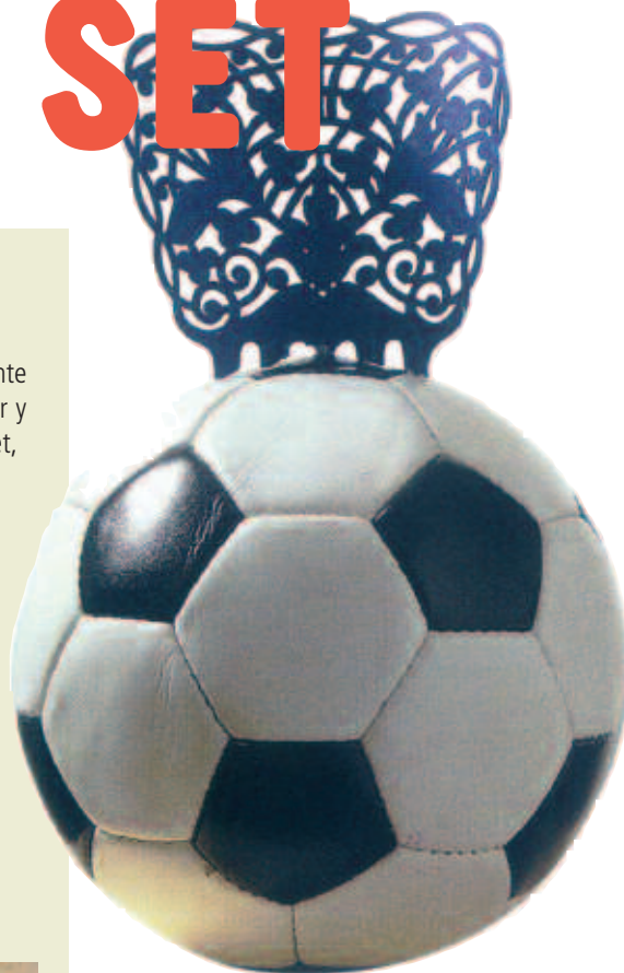
País, Joan Brossa. 1988 (Galería Joan Prats).