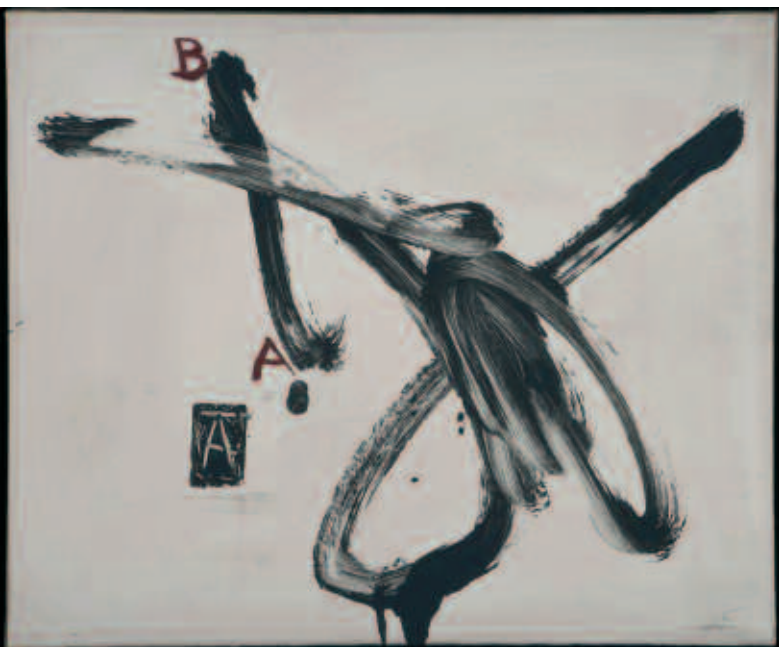
Cartas a Terera, Antoni Tàpies. 1974 (Christie's Madrid)

La imaginación desbordante de Ponç encontró salida en un automatismo tan natural, que incluso podía trabajar de noche sin apenas luz