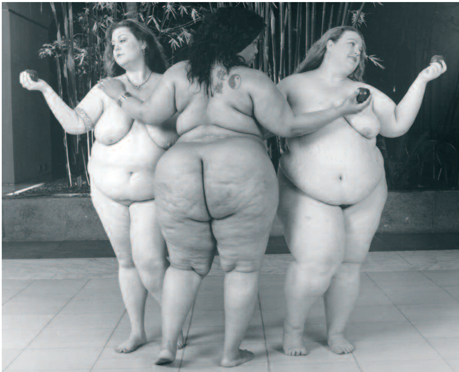
Full Body Project