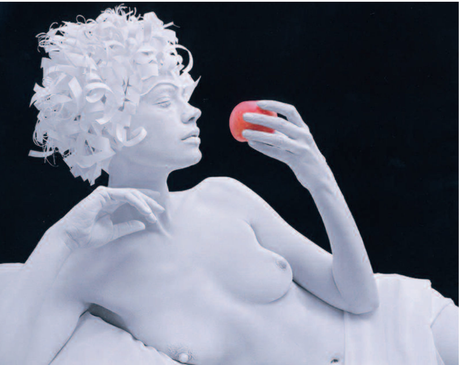
The Black and White Project