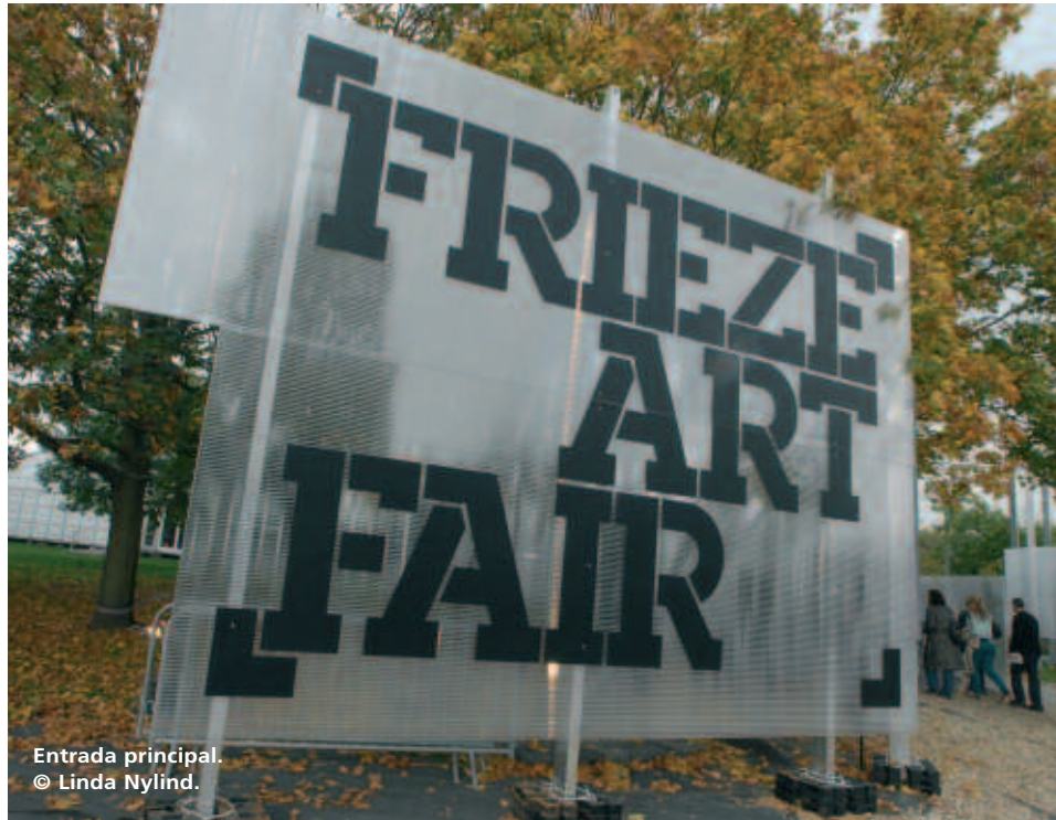
Entrada principal.

El prestigio de nuestra revista estaba en juego, por lo que nuestra única posibilidad era posicionarnos como una de las mejores ferias del mundo. Afortunadamente teníamos una lista de cuáles eran las galerías más influyentes gracias a los contactos de nuestra revista. Nuestras expectativas eran optimistas, apuntaban a que un gran número de coleccionistas vendrían a la feria. Además, Londres tiene una importante comunidad artística, y ésta se mostró muy entusiasmada arrojándonos desde el principio, al igual que el público que se sumó sin titubeos a esta iniciativa, incluso aquellas personas que nunca antes habían comprado arte vinieron a ver las obras, sólo porque estaban interesados en el arte contemporáneo.