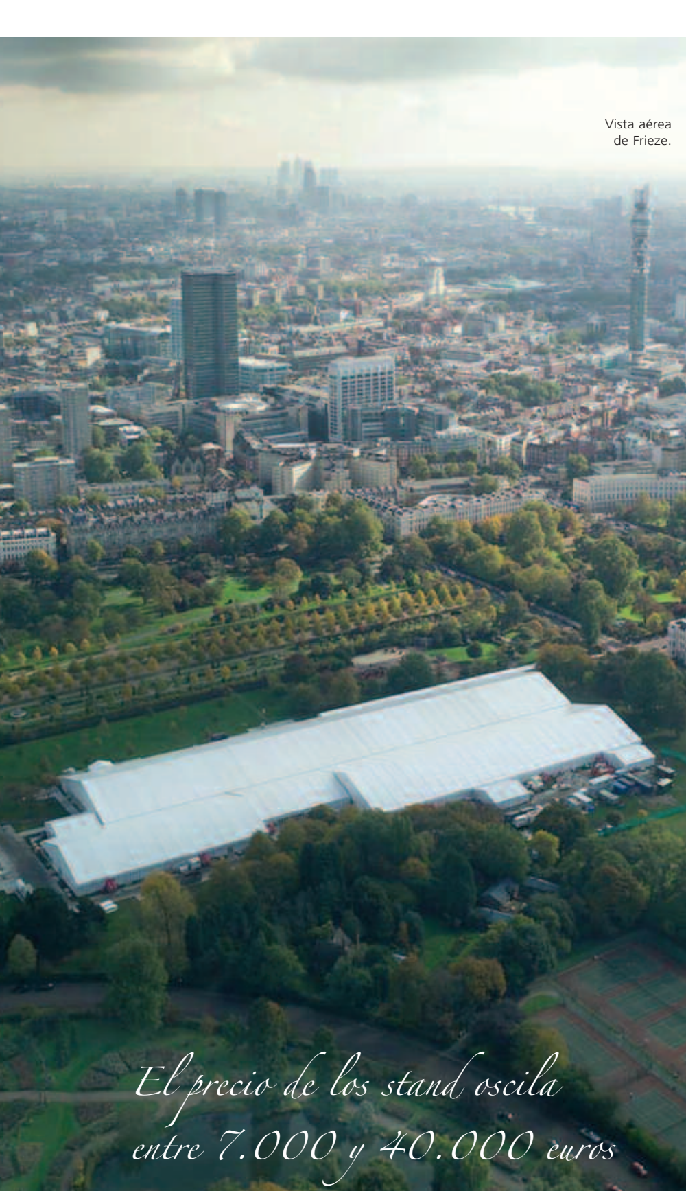
Vista aérea de Frieze.

El precio de los stand oscila entre 7.000 y 40.000 euros