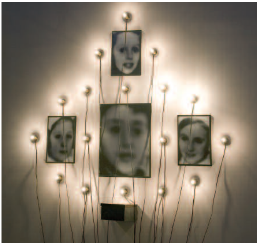
Petit Monumento Odessa, Christian Boltanski.

“Está claro que la labor de la galería -penalizada por esta ley- es fundamental. La galerías arriesgan a menudo mucho, y muchas de ellas están al límite. ¿No tendríamos las galerías que recibir parte de esos beneficios, ya que somos las primeras responsables de que el valor de una obra de arte suba?”.