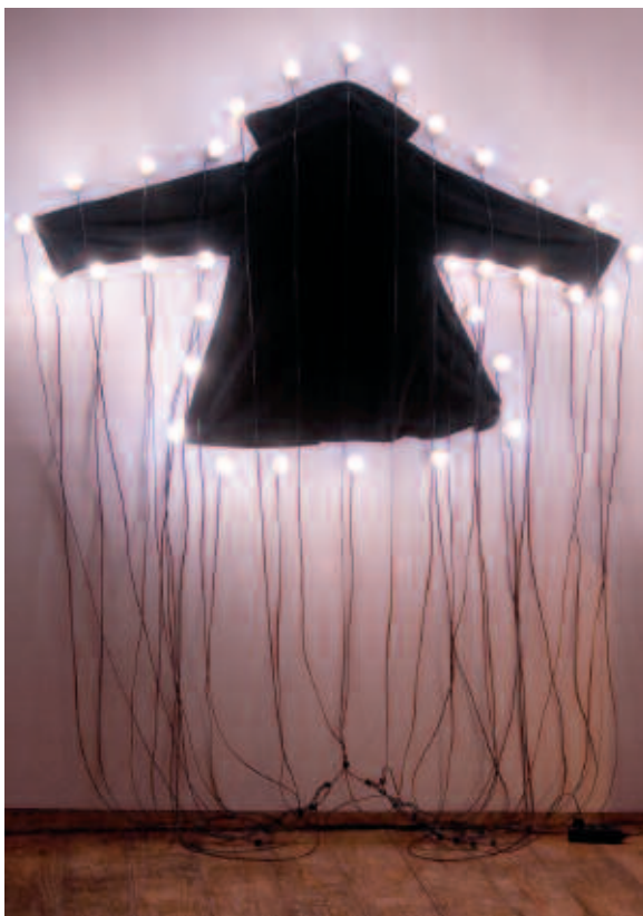
El judío eterno, Christian Boltanski.