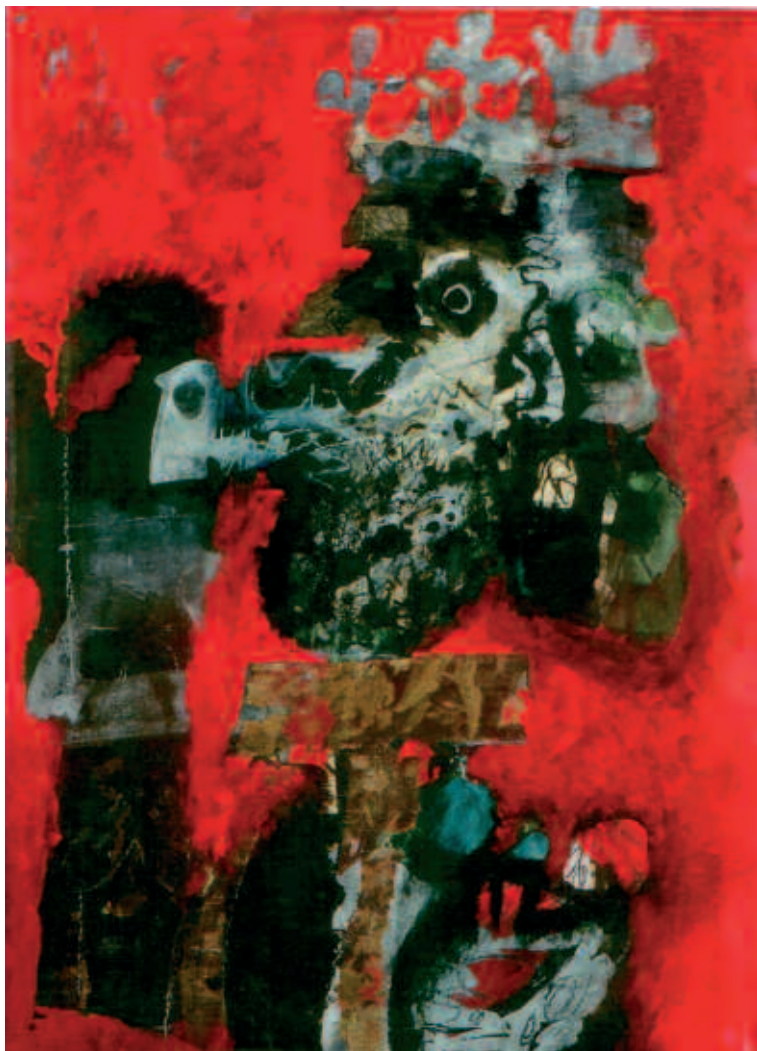
Roi, Antoni Clavé.

“El artista obtiene los rendimientos de su obra en la primera transacción y el coleccionista que compra para su disfrute no debería soportar esta carga ya que no hay un sentido especulativo sino necesidad de venta. Evidentemente afecta al mercado y en cualquier caso el porcentaje debería ser menor. El periodo de excepción debería ser al menos de unos 10 años”.