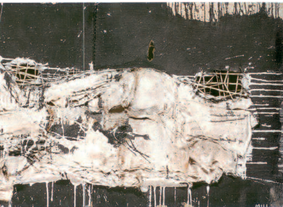
Cuadro 31, Manolo Millares . Cortesía Galería Manel Mayoral