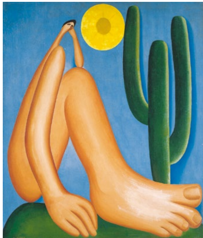
Tarsila do Amaral, Abaporu .