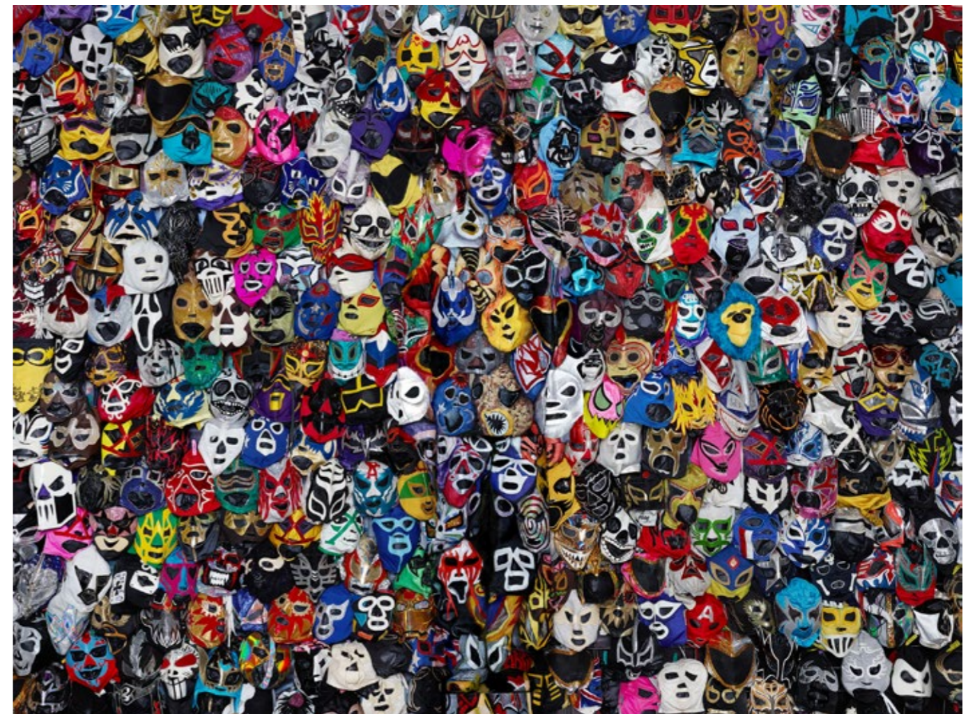
Wrestling Mask, Liu Bolin.

Expone regularmente en Europa y Estados Unidos pero ¿cómo es percibida su obra en China? Comencé a exponer en el extranjero en 2006, hace ya una década. Mis obras reciben una buena promoción a través de Internet tanto en China como fuera. De hecho, algunos medios de comunicación chinos también me han entrevistado. La gente en la esfera virtual suele estar más interesada en ver mis imágenes como si fueran un juego, una especie de puzzle. No les importa qué motivos me llevaron a camuflarme, y en general, me temo que ése es el acercamiento que tienen a mi trabajo. Pero también detecto que han empezado a preguntarse por qué elegí expresarme de esta manera.