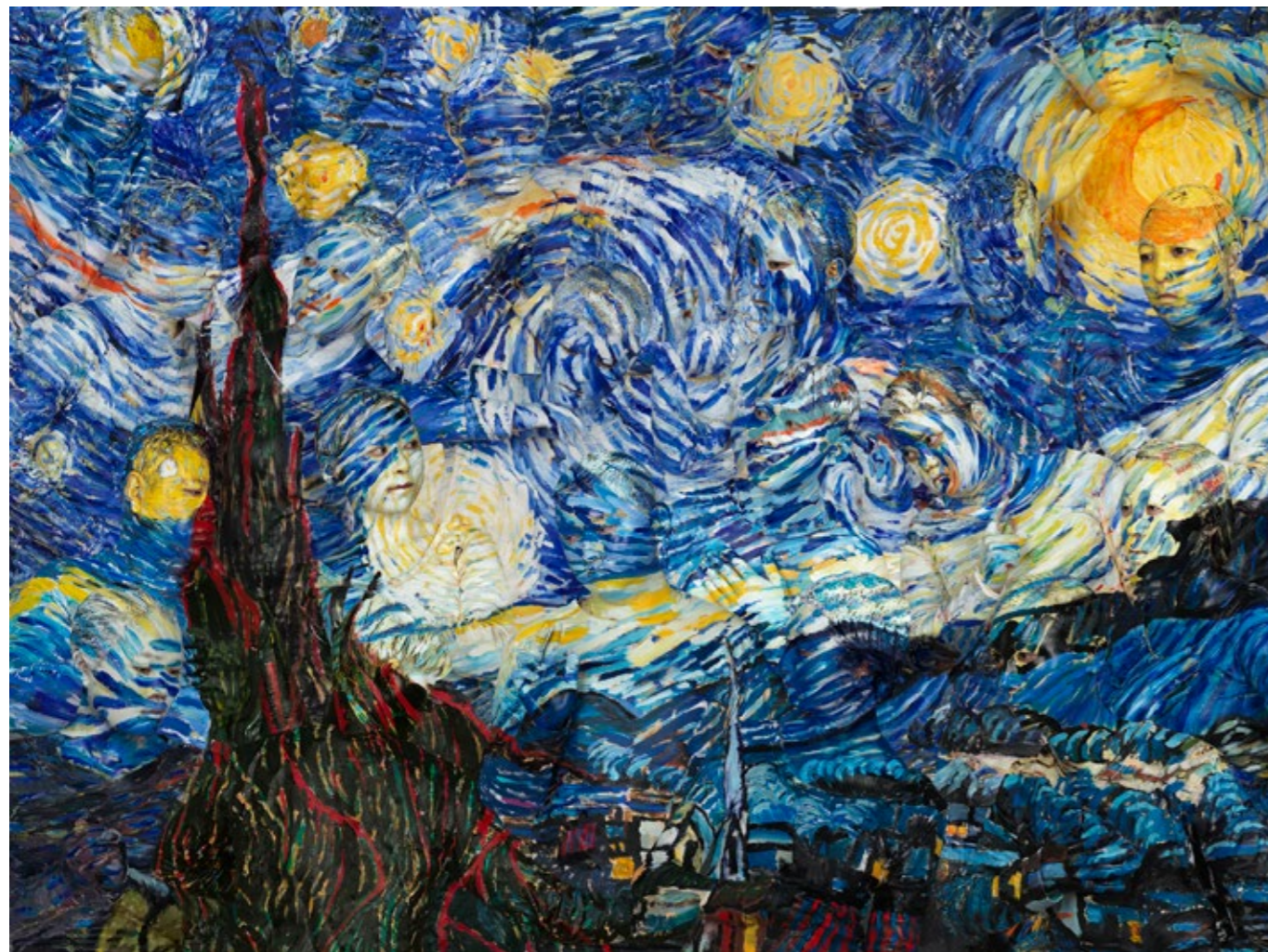
Starry Night, Liu Bolin.

¿Se sentía invisible? Más bien me sentía alguien superfluo para la sociedad. Así que esa sensación motivó mi deseo de ocultarme. Mi barrio de Suojiafen, que estaba lleno de talleres de artistas, fue demolido por la fuerza por el gobierno el 16 de noviembre de 2005, eso significó el fin de mis sueños. No me quedaba nada más que mi cuerpo. Así que lo utilicé para protestar. No tenía sentido manifestar mi disgusto usando la piedra, el hierro o alguno de estos materiales tradicionales.