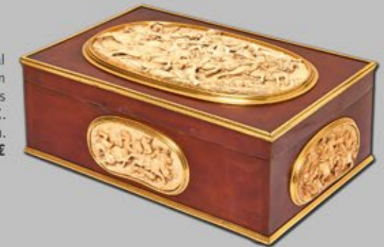
Caja alemana en metal lacado con cartelas en marfil tallado y cantoneras en latón, s.XIX. 14,5 x 33,5 x 22 cm. Salida: 6.000 €