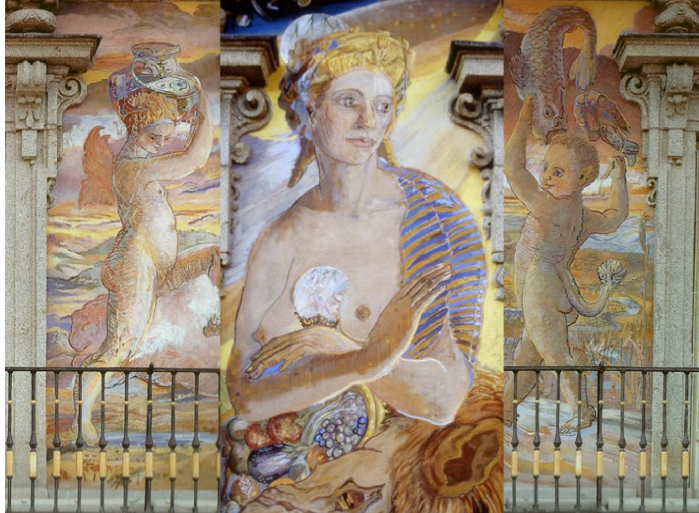
Paños de la Plaza Mayor de Madrid, Cibeles con sus hijos de Madrid, Lagunilla y Tritonillo.