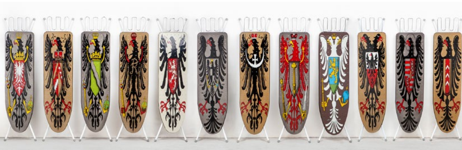
Wim Delvoye, Instalación de doce tablas de planchar, 1990. © 2017, ProLitteris, Zurich / Wim Delvoye.

Su arte se fundamenta en reinterpretaciones subversivas e irónicas de estilos pretéritos. Por ejemplo, creó vidrieras con imágenes modernas que eran rayos X de escenas sexuales.