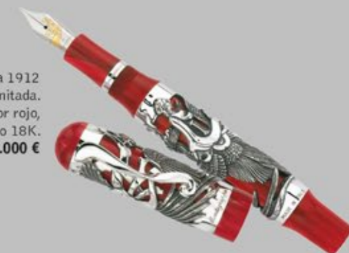
Pluma Montegrappa 1912 modelo "Eternal bird" 2005. Edición limitada. Cuerpo y capuchón en celuloide de color rojo, plata y rubies. Plumín en oro 18K. Salida: 6.000 €

Visítenos y le entregaremos el catálogo gratuitamente o entre en nuestra web www.lamasbolanosubastas.com