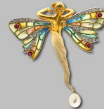
Broche-colgante diseño ninfa de la firma Masriera en oro y esmalte plique-à-jour con diamantes, rubies y perla perilla cultivada de 8 x 6 mm., fles. del s.XX. Firmado y numerado. Peso diamantes: 0,60 ct. aprox. Peso rubies: 0,35 ct. aprox. 5,5 x 5 cm. Salida: 4.000 €