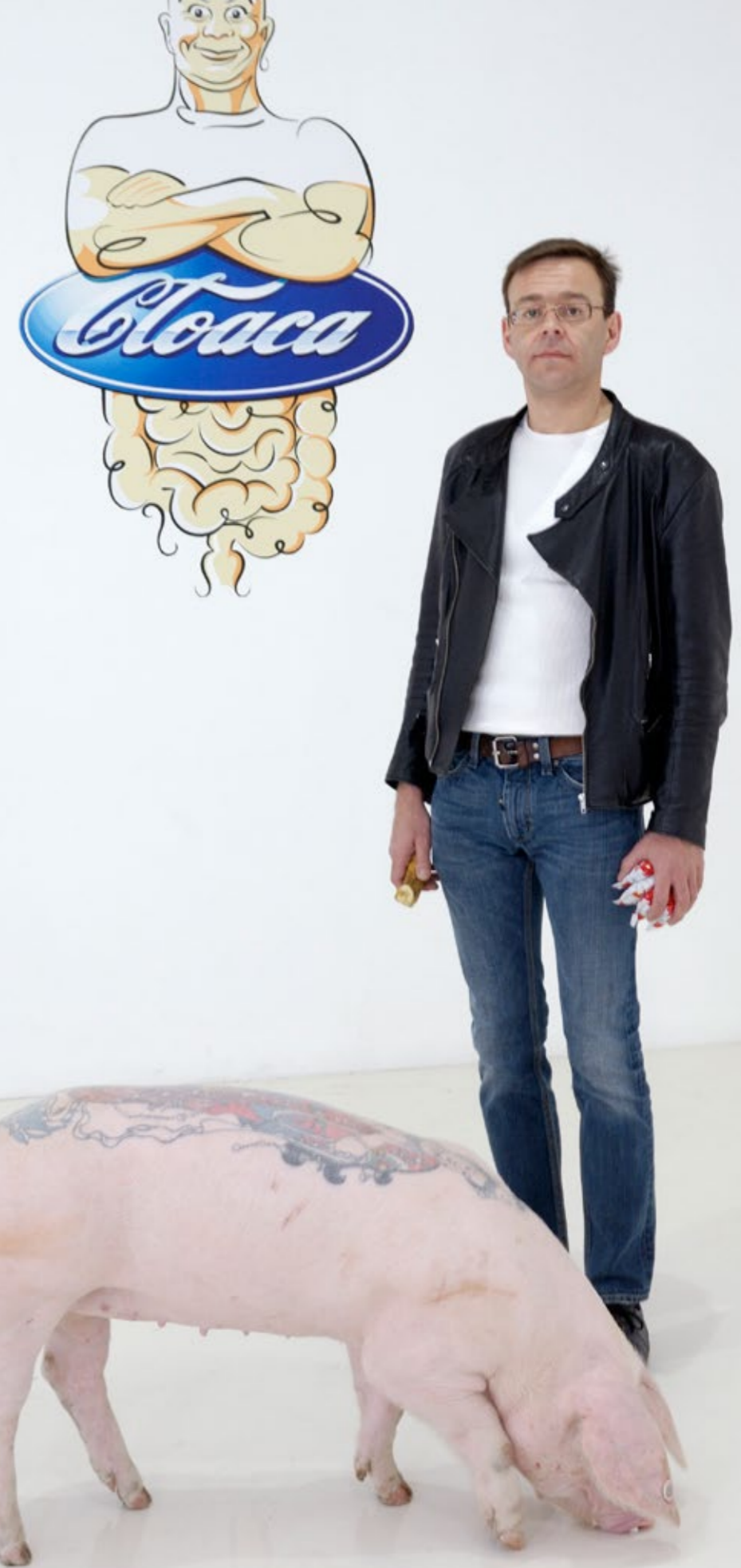
El artista Wim Delvoye, Cloaca Quattro , 2007. Xin Beijing Gallery (Beijing)

En 2001 Delvoye saltó al centro de la escena artística con sus famosas Cloacas . Estas complejas máquinas –de las que ya ha fabricado nueve modelos– utilizan enzimas y otras sustancias para reconstruir el proceso de digestión humana. Todo el tracto digestivo desde la boca hasta el ano se reproduce aislado del resto. Lo que cuenta no es la forma de los órganos individuales, sino únicamente su función fisiológica. Las primeras, como Cloaca New y Improved (2001) que se muestran en el Museo Tinguely, fueron diseñadas como máquinas de laboratorio puramente científicas. Cloaca Quattro (2004-2005), que se exhibió por primera vez en la muestra La Belgique visionnaire en 2005, deja atrás el aspecto clínico, y, con su repertorio de lavadoras y motores, se parece más a un assemblage de máquinas. Para romper la seriedad de la serie, ideó Cloaca Travel Kit (2009 - 2010) un kit de viaje montado en una maleta para facilitar su portabilidad,