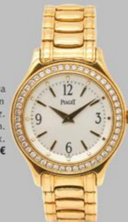
Reloj Piaget de pulsera para señora. En oro y bisel con diamantes. Mecanismo de quartz. Diám.: 25 mm. Peso diamantes: 0,50 ct. aprox. Salida: 9.000 €