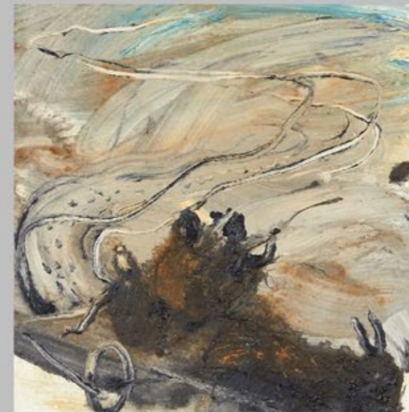
Miquel Barceló (Felanitx, Mallorca, 1957) Fali Wotoro. Técnica mixta sobre tela. Firmado, titulado y fechado en 1992 al dorso. Adjunta certificado de autenticidad expedido por la Galería Bruno Bischofberger. 35 x 35 cm. Salida: 48.000 €

Exposición de los lotes del 8 al 16 de Mayo