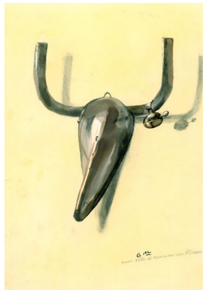
GAL, según Tête de taureau de Picasso